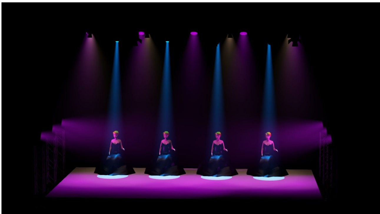
rider Bolero de Ravel - światła